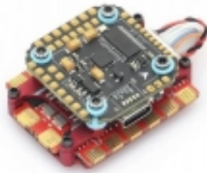
MAMBA Basic F722 MINI MK3 +RACE F60_BL32