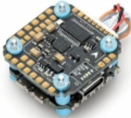
F405 MINI MK3.5 + F30 MINI