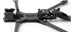
NO.6 Install the GoPro mount and the top plate