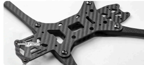
NO.3 Use M2*18, M3*20, M3*28 aluminum pillar to fix the position corresponding to the picture below