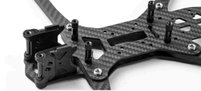
NO.5 Install the buzzer mount, T-type antenna mount, O3 VTX fixed mount, GPS mount and antenna plug