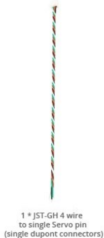
1 * JST-GH 4 wire to single Servo pin (single dupont connectors)