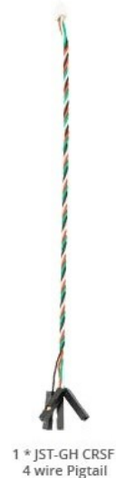
1 * JST-GH CRSF 4 wire Pigtail