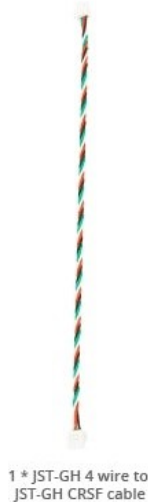
1 * JST-GH 4 wire to JST-GH CRSF cable