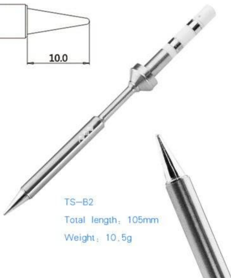
TS-B2 Total length: 105mm Weight: 10.5g