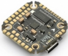
MAMBA F722 MINI MK3