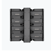
TB51 Intelligent Battery Charging Hub × 1