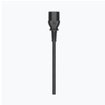
TB51 Intelligent Battery Charging Hub AC Cable × 1