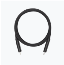
USB-C to USB-C High- Speed Data Cable × 1