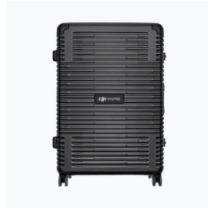
Inspire 3 Trolley Case × 1