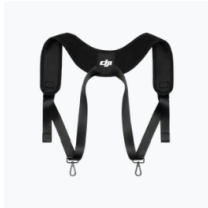
RC Plus Strap × 1