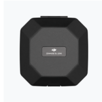
Lens Carrying Box (18/24/35/50mm) × 1