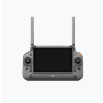
RC Plus × 1