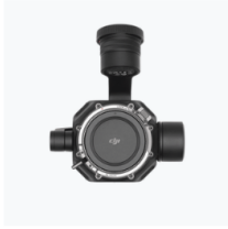
Zenmuse X9-8K Air Gimbal Camera × 1