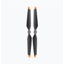
Inspire 3 Foldable Quick-Release Propellers (Pair) × 3