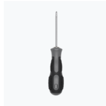
Double-Headed Screwdriver × 1