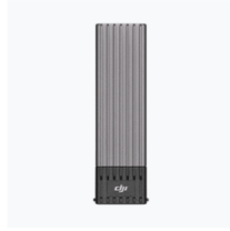
PROSSD 1TB × 1