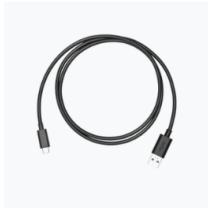
USB-C to USB-A Data Cable × 1