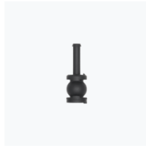
Inspire 3 Gimbal Rubber Dampers × 2