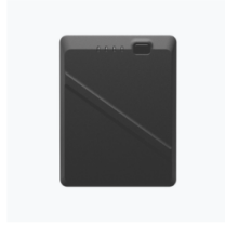
TB51 Intelligent Battery × 6