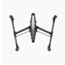
Inspire 3 Aircraft × 1