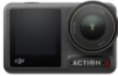
DJI CARE REFRESH (OSMO ACTION 4)

Link do produktu: https://www.nobshop.pl/dji-care-refresh-dji-osmo-action-4-dwuletni-plan-kod-elektroniczny-p-4129.html