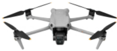
DJI CARE REFRESH ( DJI AIR 3 )

Link do produktu: https://www.nobshop.pl/dji-care-refresh-dji-air-3-roczny-plan-kod-elektroniczny-p-4131.html