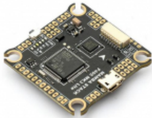
MAMBA F405 MK3 LITE