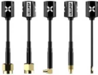
SMA RP-SMA Angle MMCK Straight MMCK UFL